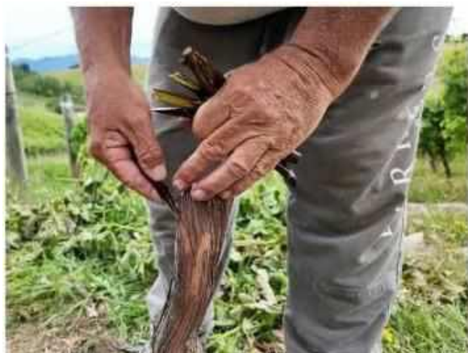
ネッビオーロの接ぎ木