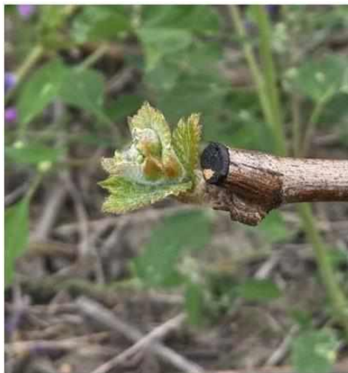
Blank Canvas Nebbiolo!